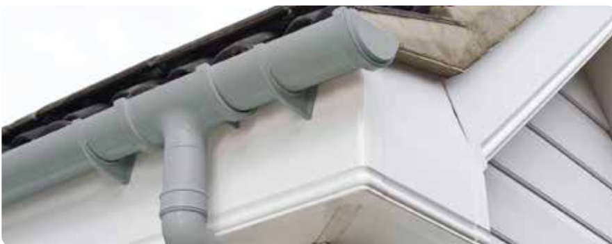
UPVC Rainwater Pipes