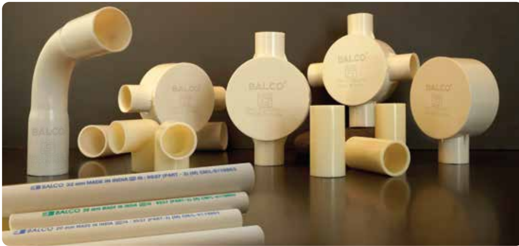
Ivory Conduits and Fittings